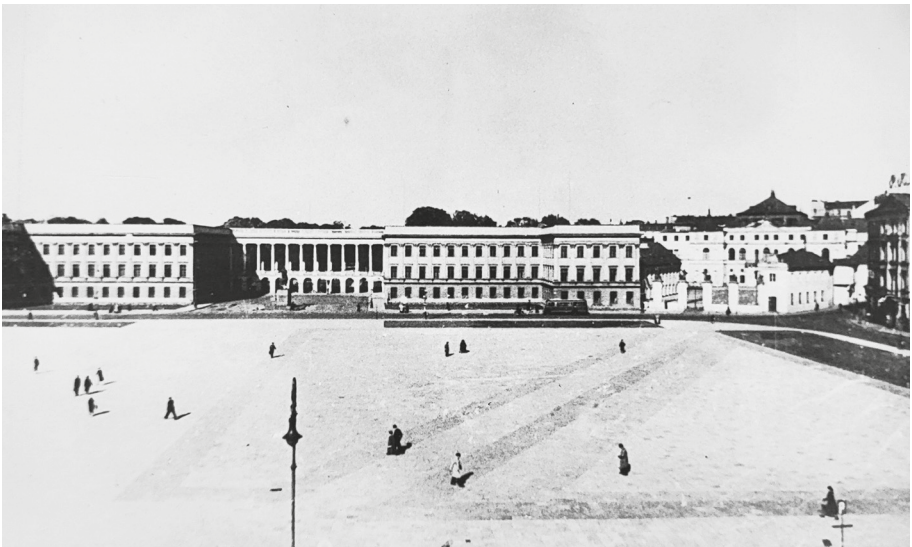
Ryc. 6. Pałac Saski i Pałac Brühla, 1938 r.