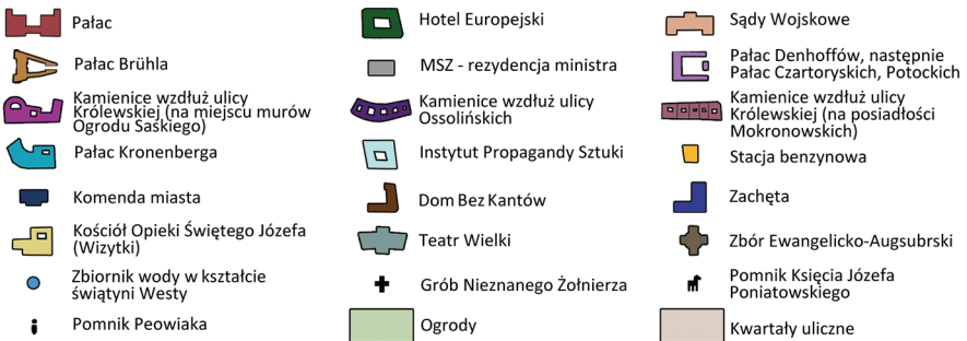
Ryc. 8. Plac Marszałka Józefa Piłsudskiego i jego otoczenie w 1939 r.