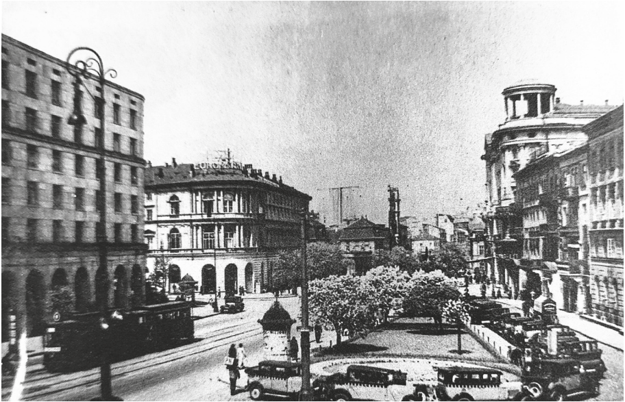
Ryc. 5. Dom Bez Kantów i Hotel Europejski od strony Krakowskiego Przedmieścia, lata 30. XX w.