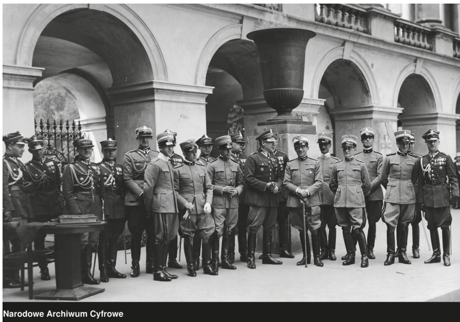
Ryc. 3. Włoski dyplomata płk Mario Roatta (opiera się o szablę) i płk Bolesław Wieniawa-Długoszowski przed Grobem Nieznanego Żołnierza, 1930 r.