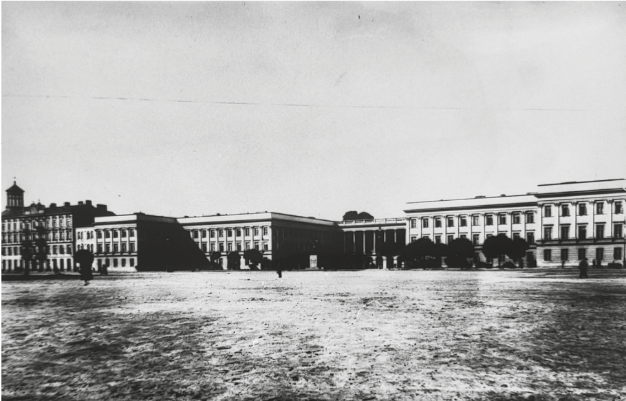
Ryc. 1. Pałac Saski i kamienica przy rogu ulicy Królewskiej, 1926 r.