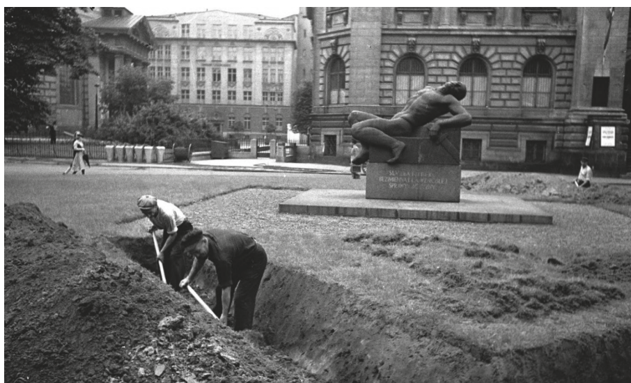
Ryc. 4. Pomnik Peowiaka, lata 30. XX w.