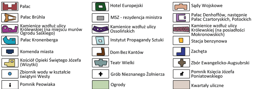
Ryc. 8. Plac Marszałka Józefa Piłsudskiego i jego otoczenie w 1939 r.