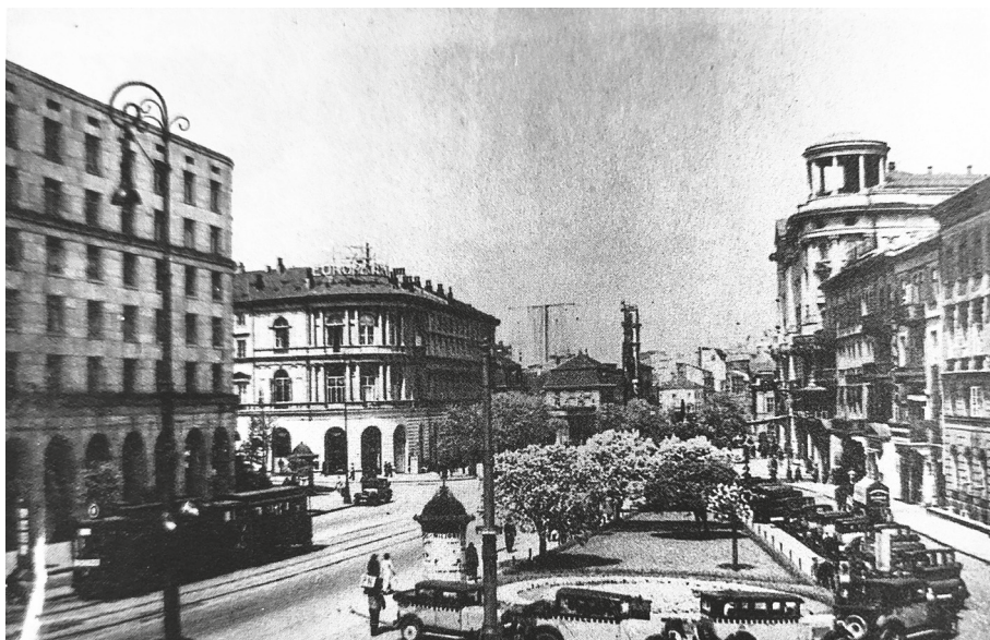
Ryc. 5. Dom Bez Kantów i Hotel Europejski od strony Krakowskiego Przedmieścia, lata 30. XX w.