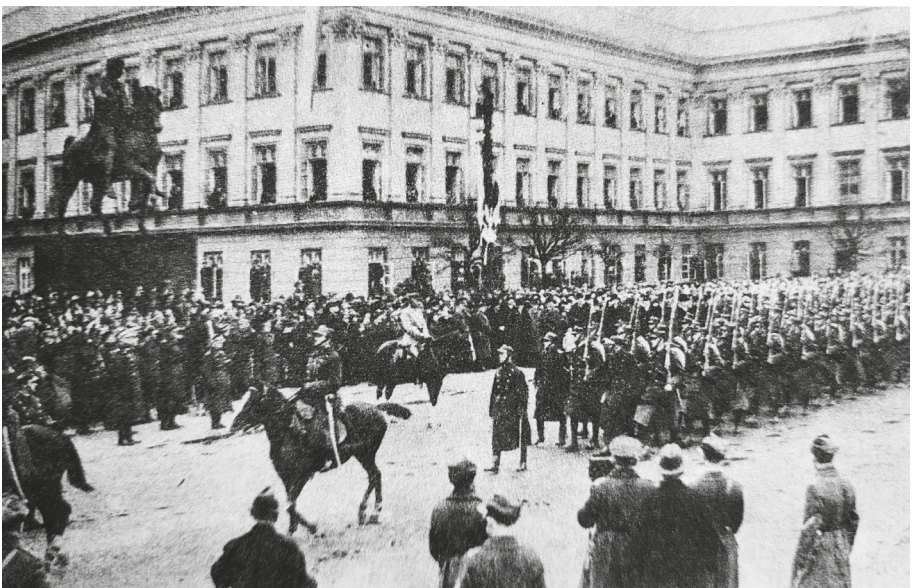
Ryc. 2. Marszałek Józef Piłsudski dokonuje przeglądu oddziałów wojskowych przed pomnikiem księcia Józefa Poniatowskiego i Pałacem Saskim, 11 listopada 1926 r.