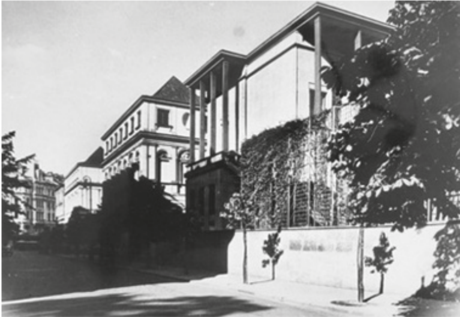
Ryc. 7. Pałac Brühla – Ministerstwo Spraw Zagranicznych i rezydencja ministra, widok od ulicy Fredry, 1939 r.