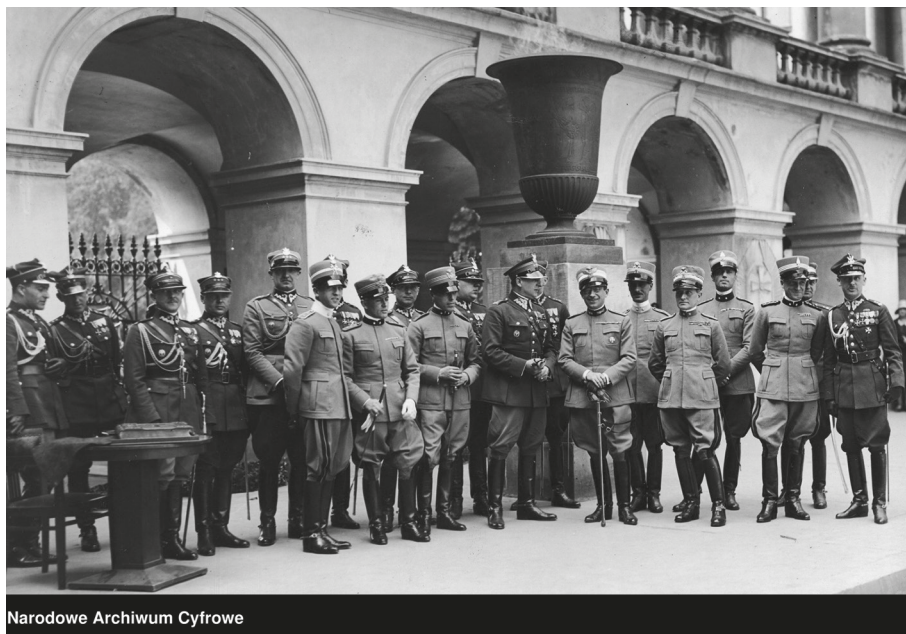
Ryc. 3. Włoski dyplomata płk Mario Roatta (opiera się o szablę) i płk Bolesław Wieniawa-Długoszowski przed Grobem Nieznanego Żołnierza, 1930 r.