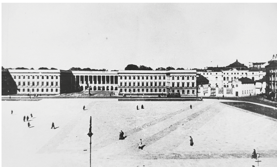
Ryc. 6. Pałac Saski i Pałac Brühla, 1938 r.