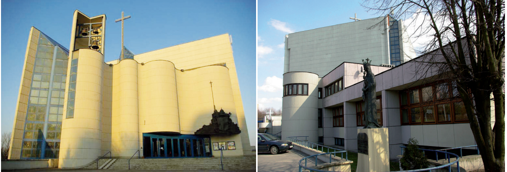
fot. Joanna Gil-Mastalerczyk, 2013

sakralnej budowane były łącznie z obiektami towarzyszącymi, mieszczącymi różnego rodzaju pomieszczenia potrzebne do zaspokajania potrzeb parafialnych, a także wyposażone w niezbędną do tego celu przestrzeń. Kościół św. Jadwigi na Krowodrzy w Krakowie posiada dwa skrzydła zabudowań parafialnych o funkcji pomocniczej, dziedziniec kościelny oraz kilka boisk sportowych (ryc. 1).