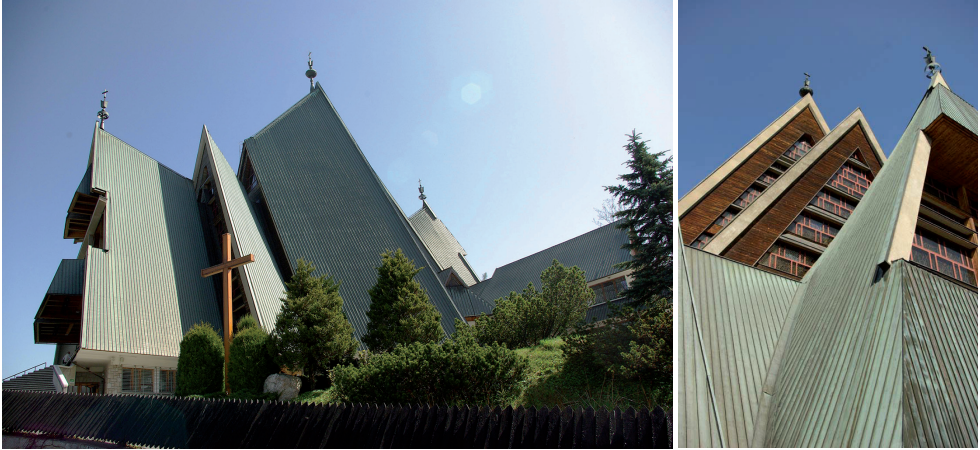
Ryc. 4. Kościół Najświętszej Marii Panny Niepokalanej Objawiającej Cudowny Medalik na Olczy w Zakopanem, 1981-1988