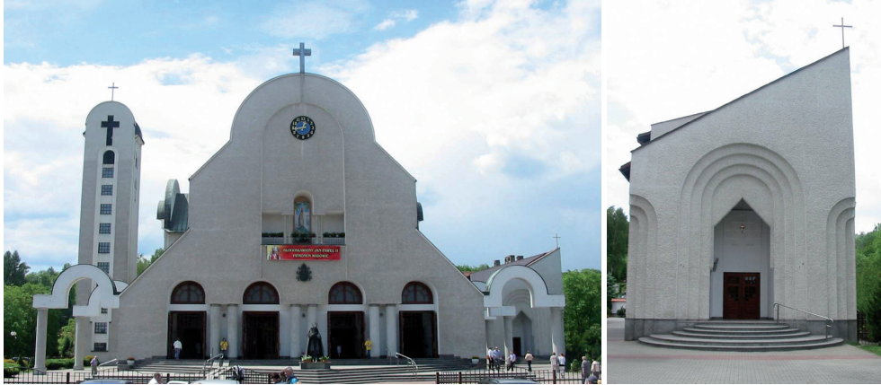
fot. Joanna Gil-Mastalerczyk, 2013

Powrót do eksponowania fasady następuje w latach 80. XX w. – poprzez różnorodne ukształtowanie architektoniczne – rzeźbiarskie prześwity, geometryczne podcięcia (kościół na Lotnisku w Czyżynach Nowej-Hucie) oraz formy tworzące dynamiczne i ekspresyjne kompozycje (kościół św. Królowej Jadwigi na Krowodrzy).